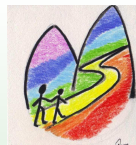
Marcia per la pace